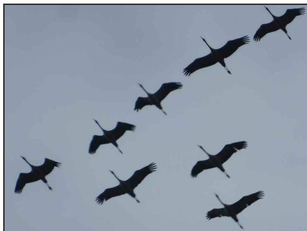
PASSAGE DE GRUES CENDRÉES