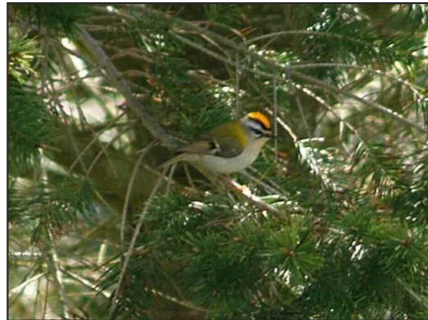
ROITELET TRIPLE BANDEAU